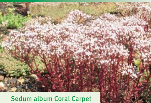
Sedum album Coral Carpet