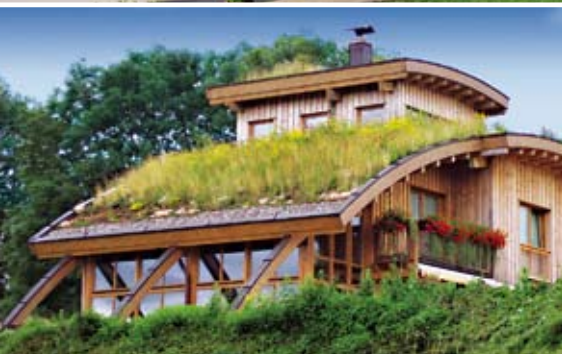
Extenzivní strmé zelené střechy