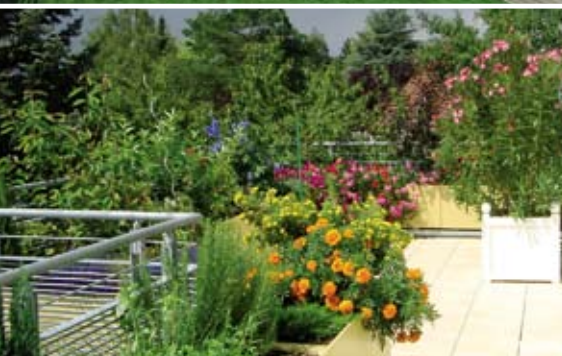
Kontejnery na rostliny jako zelené ostrůvky na terase