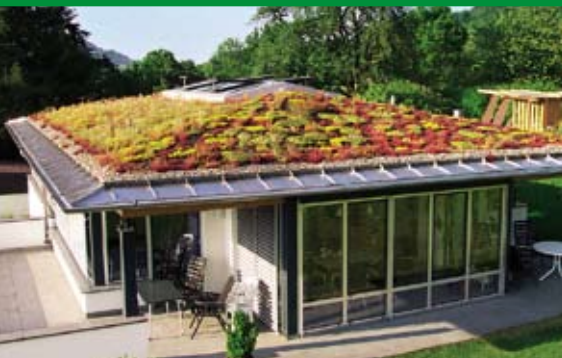
Extenzivní ploché a šikmé zelené střechy