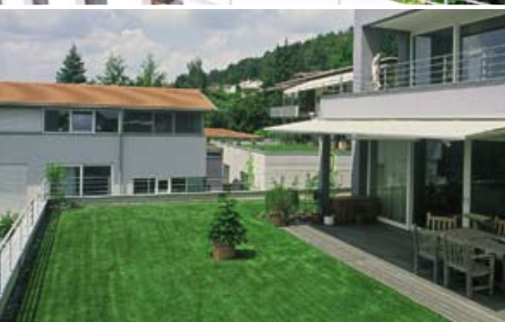
Intenzivní zelené střechy s pobytovým trávníkem