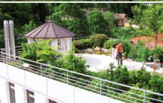
Užitné střešní zahrady s terasou