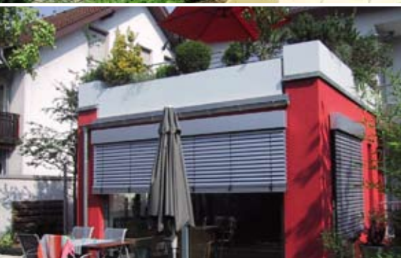
Kontejnery na rostliny jako okraj terasy se zábradlím

Optigreen již po několika desetiletích úspěšně působí v oboru zelených střech a své zkušenosti a aktuální poznatky předává svým vyškoleným specialistům - partnerským realizačním firmám.