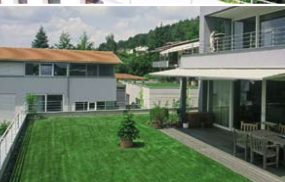
Intenzivní zelené střechy s pobytovým trávníkem