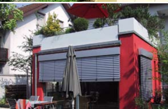
Kontejnery na rostliny jako okraj terasy se zábradlím

Optigreen již po několika desetiletích úspěšně působí v oboru zelených střech a své zkušenosti a aktuální poznatky předává svým vyškoleným specialistům - partnerským realizačním firmám.